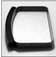
Yağ toplama tepsi