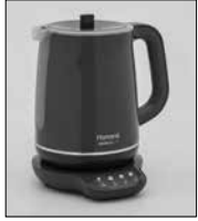
Su ısıtıcısı Royaltea 1701-1713