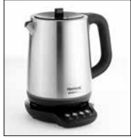
Su ısıtıcısı Royaltea 1708-1709