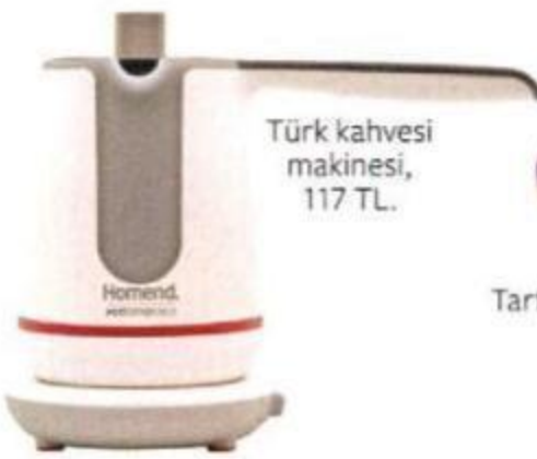
Türk kahvesi makinesi, 117 TL.