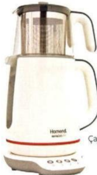
Çay makinesi, 237 TL.