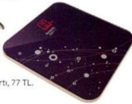
Tartı, 77 TL.