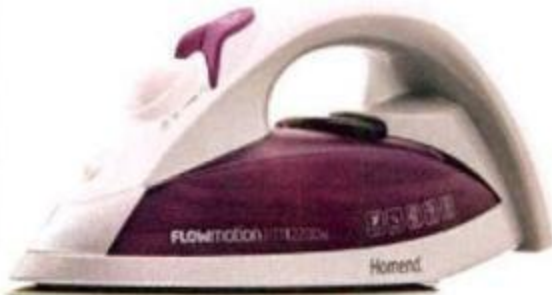
Ütü, 187 TL.